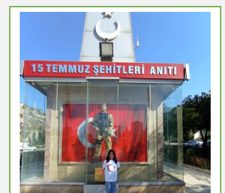
4/C Sınıfı 15 Temmuz Şehitler Anıtı Ziyareti