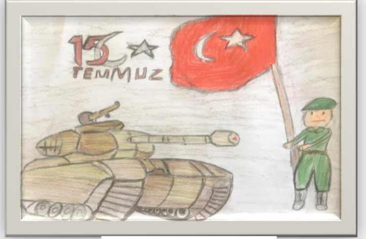
Beril Erva Yıldırım 4/C