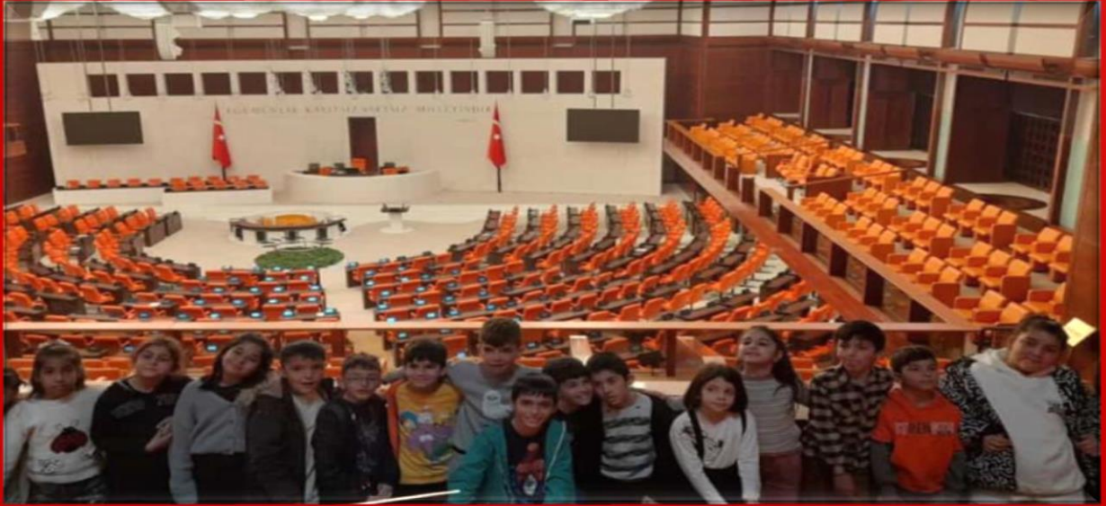
4/C Sınıfı TBMM Gezisi