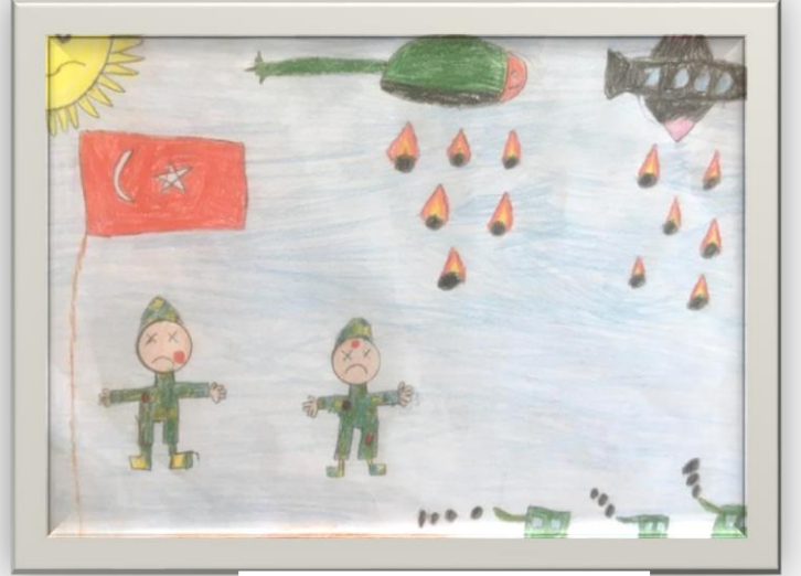
Sevde Naz Şahin 4/C