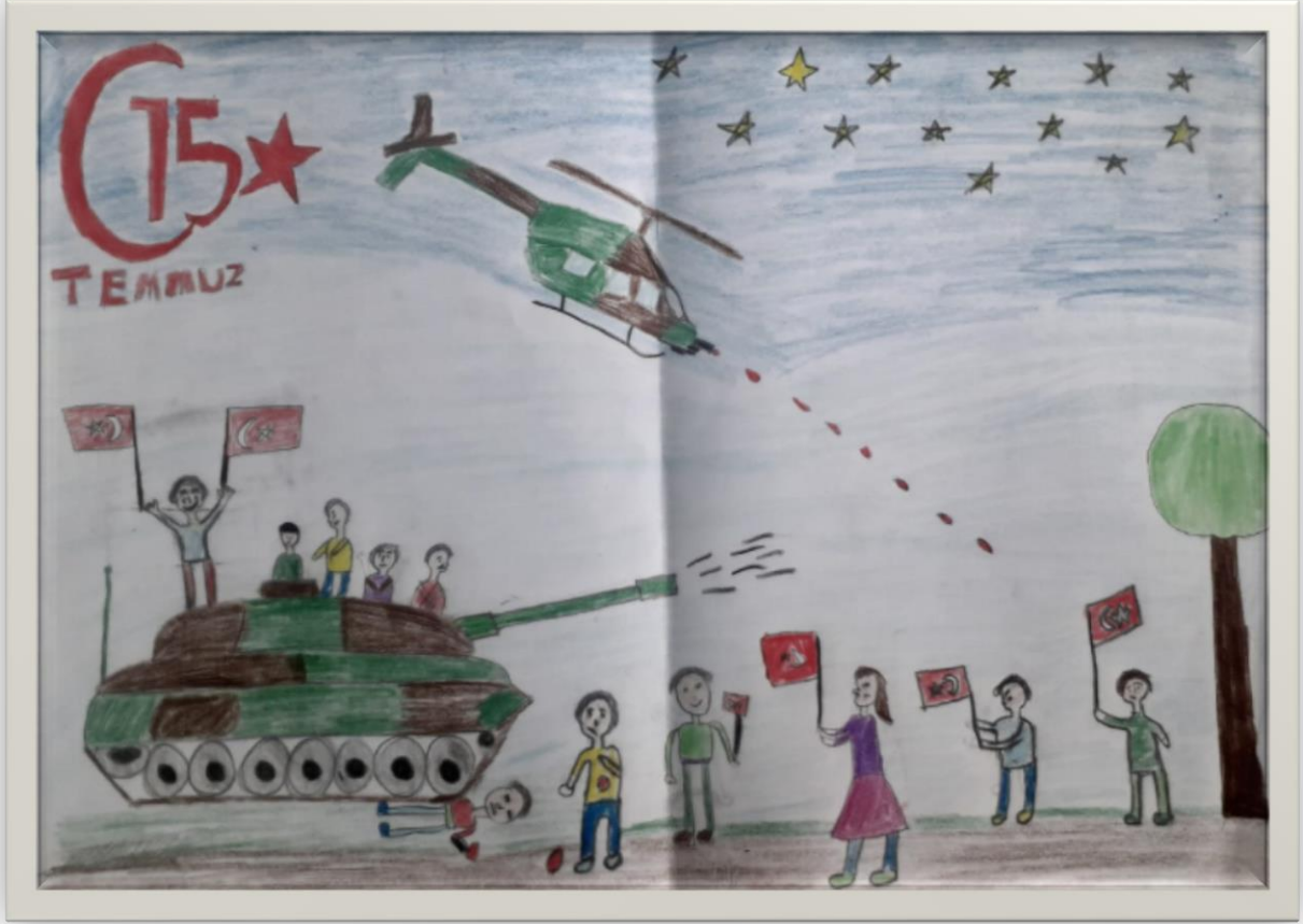
Elif BERRA KAYABAŞI 4/B